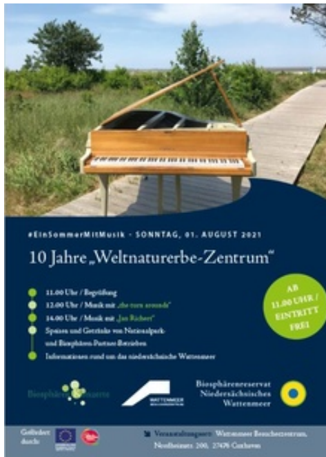
Biosphären Konzert Cuxhaven

Zusätzlich freuen wir uns natürlich, dass sich die Pandemie-Lage entspannt und Veranstaltungen unter bestimmten Regeln wieder stattfinden dürfen.